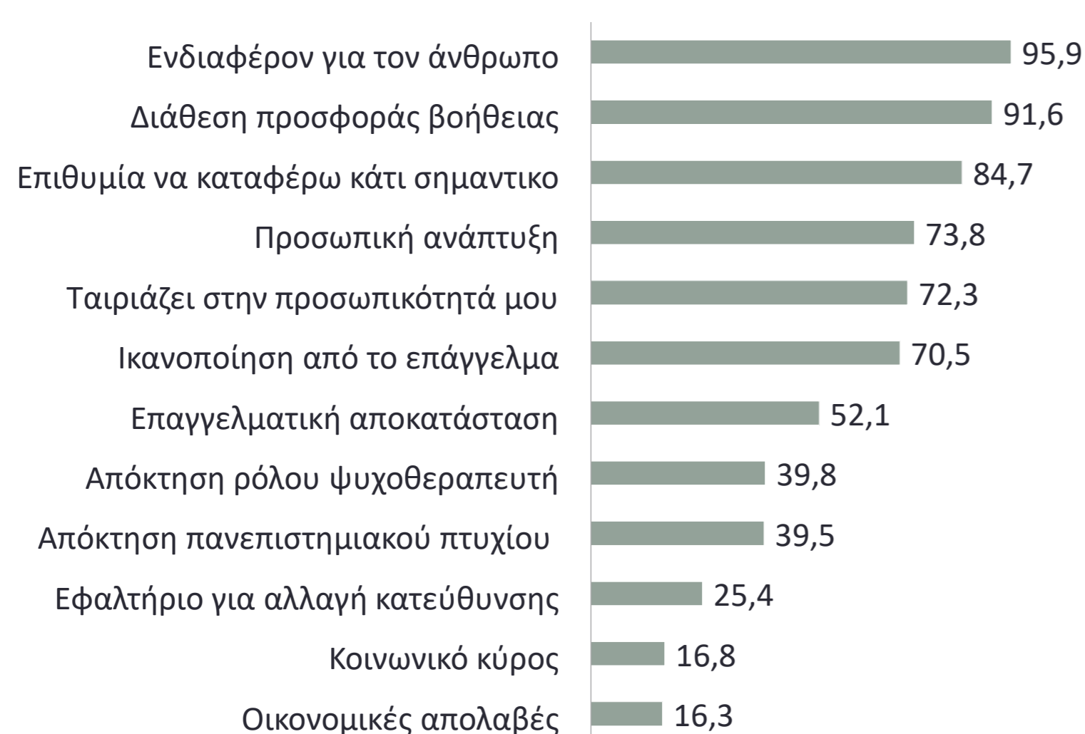
Γράφημα 1. Κίνητρα επιλογής επαγγέλματος

Σύμφωνα με το Γράφημα 1, τα εσωτερικά κίνητρα υπερίσχυσαν των εξωτερικών. Για τη συντριπτική πλειοψηφία, το ενδιαφέρον για τον άνθρωπο και η διάθεση για προσφορά βοήθειας αποτέλεσαν τα σημαντικότερα κίνητρα.